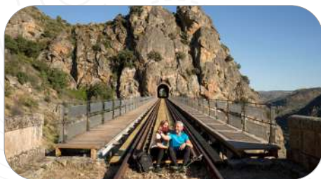
Camino de Hierro, La Fregeneda